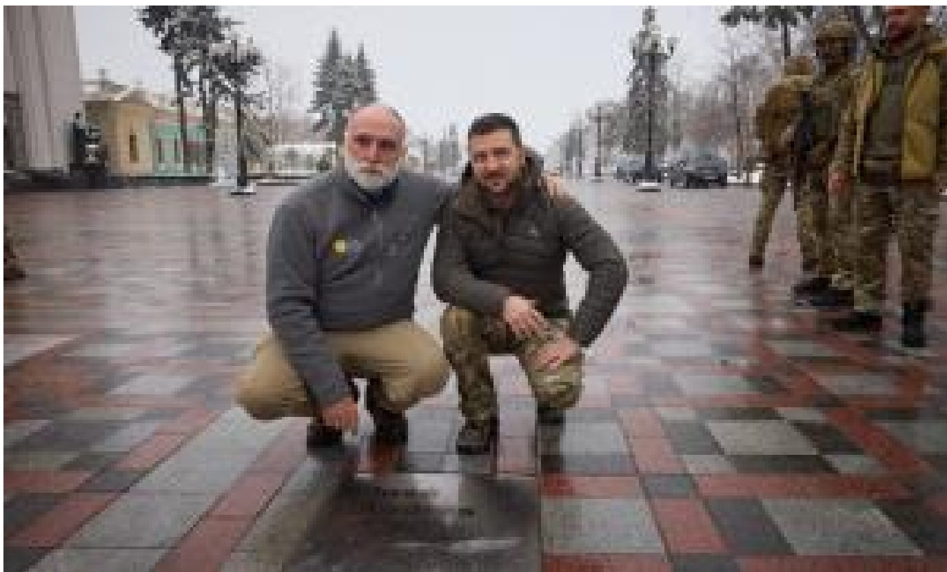
На Алеї сміливості з'явилася табличка, присвячена благодійнику Хосе Андресу (/ukraine/133896)

СБУ передала до суду справу на особистого інформатора Стрелкова-Гірка (/ukraine/133895)