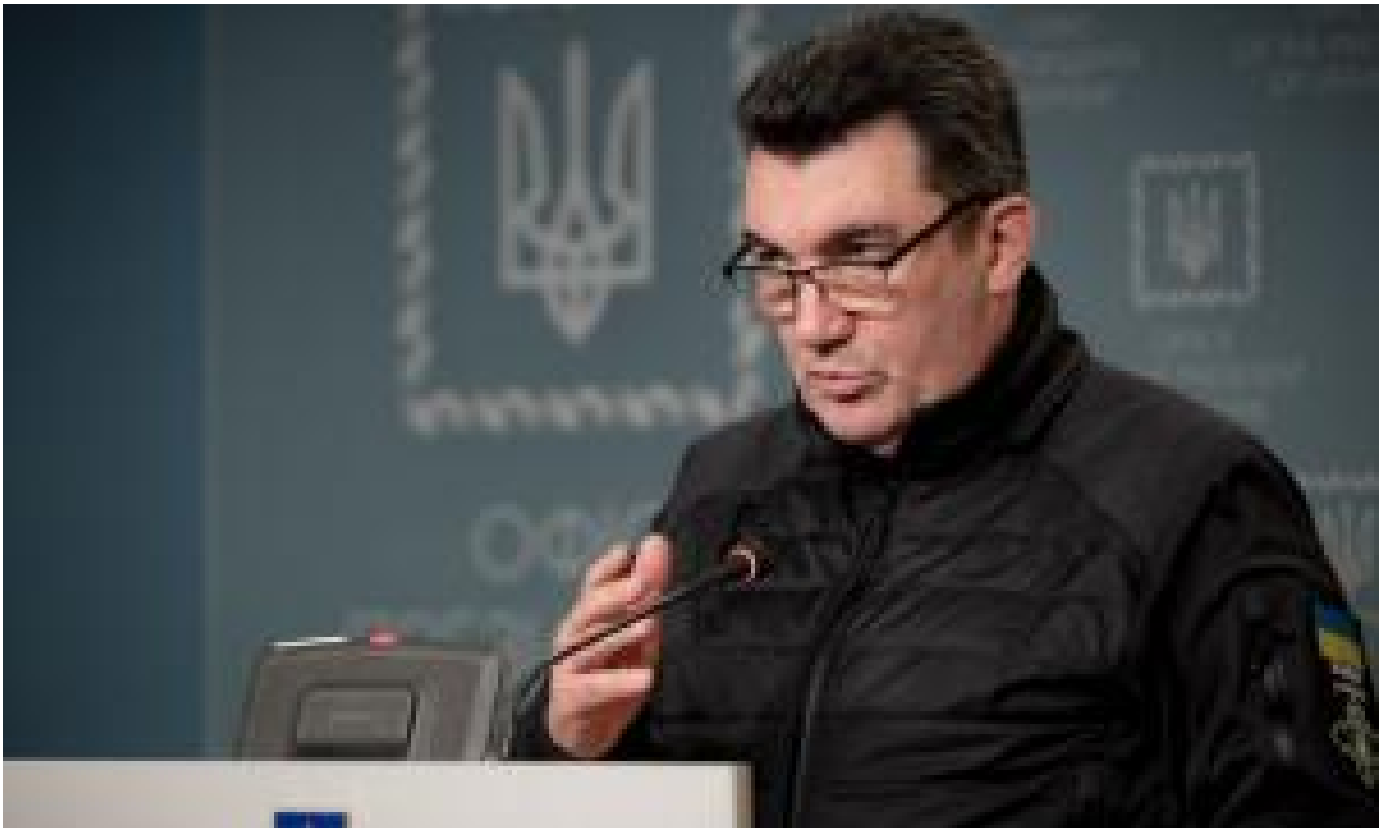
Олексій Данілов: Розробка вітчизняної зброї – пріоритет державної політики України (/ukraine/133905)